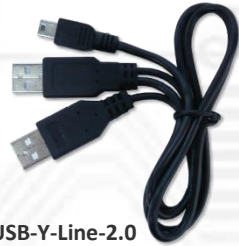
USB-Y-Line-2.0 (USB 2.0 Y 字ケーブル) x1