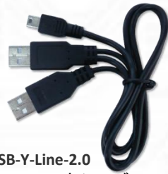
USB-Y-Line-2.0 (USB 2.0 Y 字ケーブル) x1