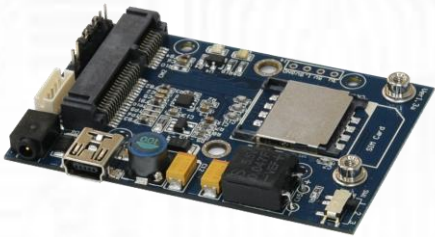
USBMI モジュール (無線通信 Mini Card 用 USB アダプタ ver.1.3b) x1 * モジュールのみ。筐体はなし。