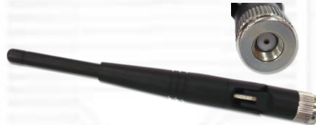
ANT2400Q2P 2.4GHz 2.15dBi ラバーダックアンテナ