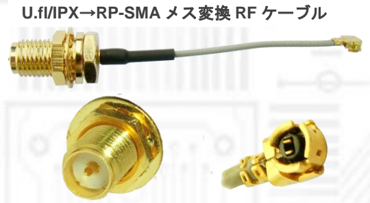
U.fl/IPX→RP-SMA メス変換 RF ケーブル